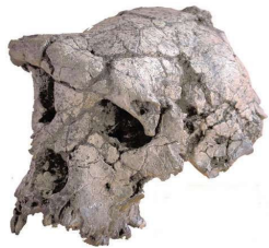
crâne fossilisé de Toumaï