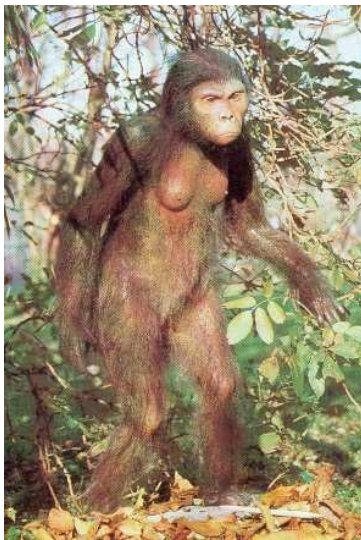
squelette et reconstitution de Lucy