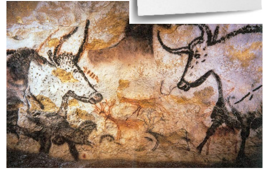
peinture de la Grotte de Lascaux (17000 av JC)