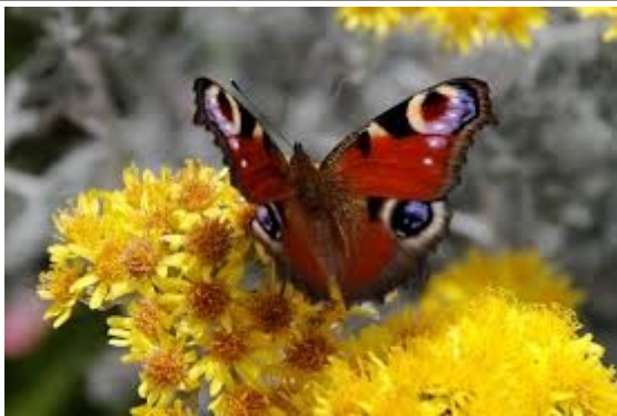
Le Paon du jour

Mais oui ! Le copain de Renaud ! Le bourdon Mais aussi beaucoup de papillons :