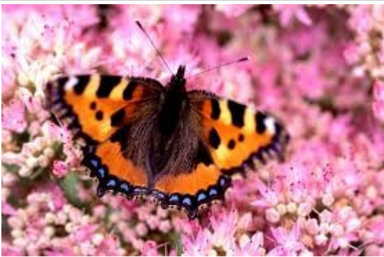
La petite tortue