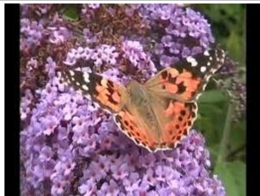
La belle dame