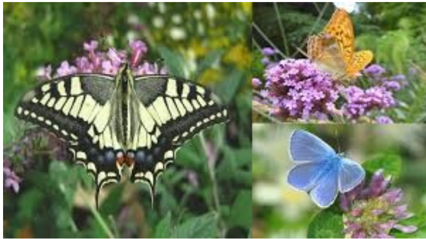
Le machaon (à gauche), le tabac d'Espagne (en haut à droite) et l'argus bleu

Et nous voilà dans une drôle de situation car ces papillons qu'il faut protéger quand ils pollinisent les fleurs, sont à d'autres moments nos terribles ennemis quand ils ne sont encore que des chenilles !